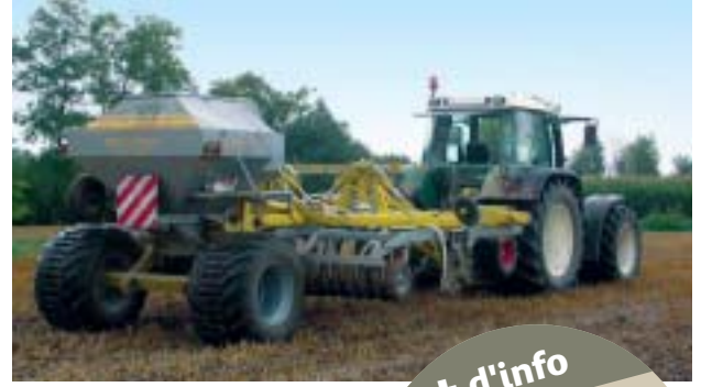
Le semoir 4,5 m avec sa trémie à l'arrière.

Avec sa centrale hydraulique indépendante fixée sur l'attelage du tracteur et son pivot reculé